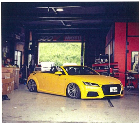
表紙：アウディ TTロードスター