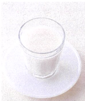
酒粕でつくる 基本の甘酒で アレンジいろいろ！