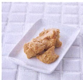
手軽に食べられる モチモチ食感 酒粕モッツアレラ