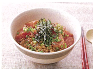
酒粕でつくる 万能旨味調味料！ 「神だれ」活用法